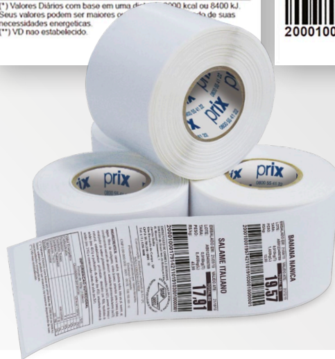
Layouts de etiquetas ilustrativos.