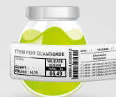
Exemplo de aplicação